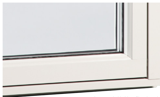
Aluminiumbeklädd profilerad utsida

Fönster med beslag som gör det möjligt att vrida runt fönsterbågen 180 grader så att fönstrets utsida hamnar inåt rummet. Fönstret levereras alltid med utfallsspärr som kräver två händer för att öppnas. Läs mer om våra produkter på outline.se