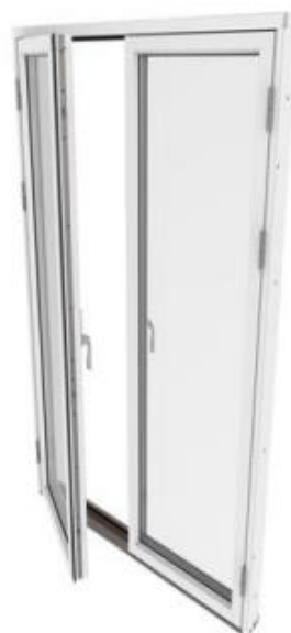
ex. vänster gångdörr

En Pardörr har som standard mötes spanjoletter och då är det viktigt att ange vilken dörr som är gångdörr = öppnas först. Och man ser detta ALLTID utifrån sett. Hakkolvs spanjolett till gångdörr Mötes spanjolett till passivdörr