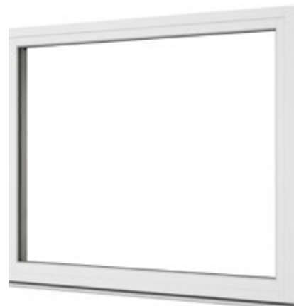
Fast karm sedd från insidan.