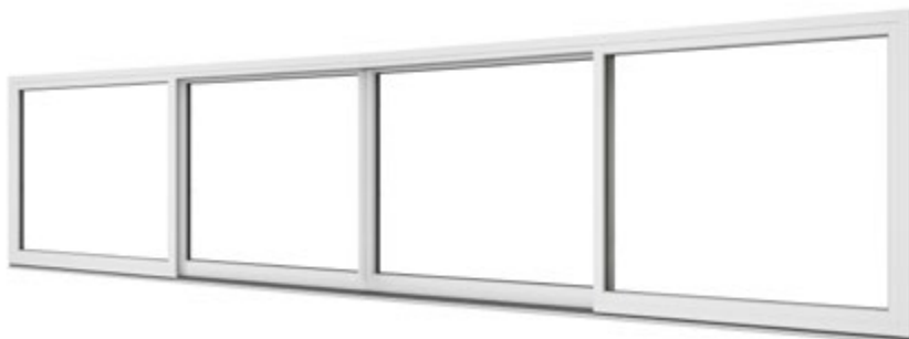
Skjutedörr sedd från insidan.

Tröskel i Merbau (ädelträ) höjd 55 mm. Låg tröskel 25 mm som tillval.