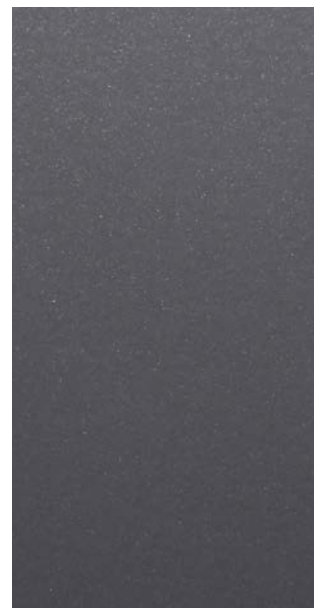
Y2215F Steel Blue Gray 715