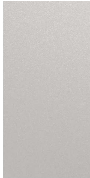
YW201E Anodic Ice