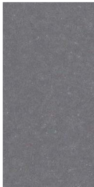
YX214E Steel Blue Gray 713