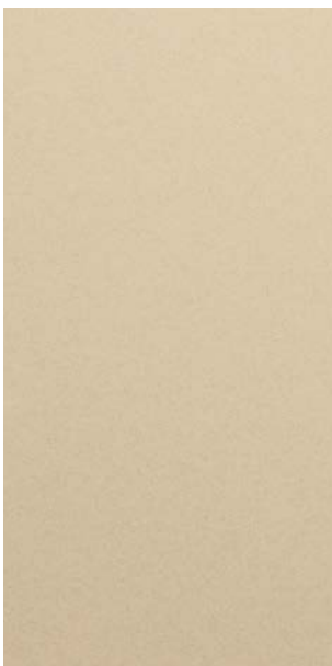
YW255F Golden Beach