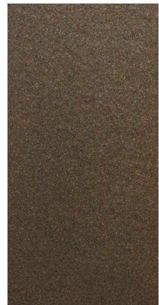
Y2214F Anodic Bronze