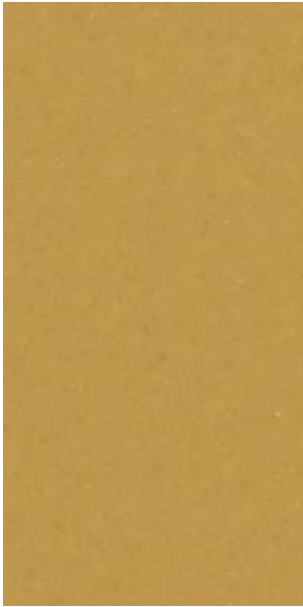
YY217E Gold Pearl