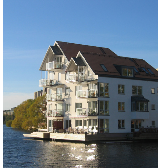
Utsida, fast karm