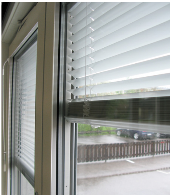
Exempel på mellanglaspersienn

Mellanglaspersienn levereras alltid monterad.