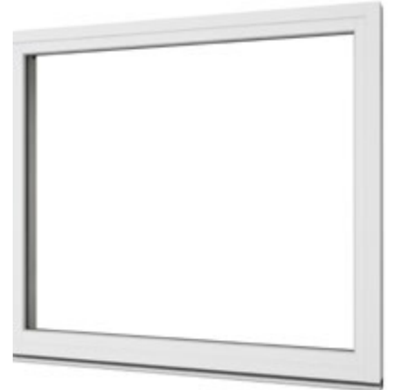
Fast karm sedd från insidan.