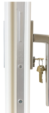
Beslagspaket 4 Invändigt handtag förberett för låscylinder Assa 1200/1300, utvändigt fingergrepp.