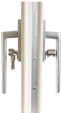
Beslagspaket 3 Invändigt handtag med spärrvred, utvändigt låsbart handtag.