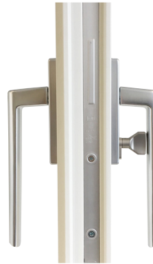
Beslagspaket 2 In- och utvändigt handtag med invändigt spärrvred.