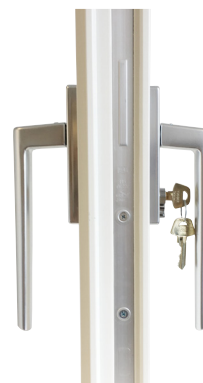
Beslagspaket 6 In- och utvändigt handtag förberett för låscylinder Assa 1200/1300.