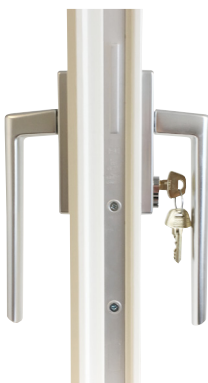
Beslagspaket 5 In- och utvändigt handtag, invändigt handtag förberett för låscylinder Assa 1200/1300.