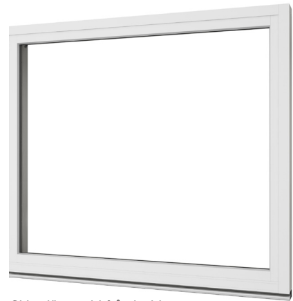
Skjutedörr sedd från insidan.