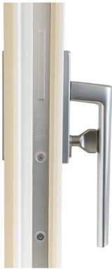
Beslagspaket 1 Invändigt handtag med spärrvred, utvändigt fingergrepp.